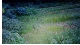
ととき谷戸は夜にタヌキの子供の遊び場