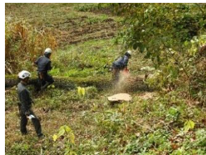
11月24日 藤蔓の絡まった木の伐採