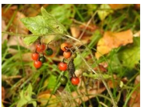
ヒヨドリジョウゴ